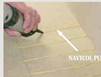
1 - Nach der leimlosen Verlegung, streifenförmige Verleimung mit NAVYCOL

PFLEGE: Um den Glanz des Parkett zu behalten, Sie brauchen nur das Navyhuile -Öl über das Parkett applizieren und aufwischen.