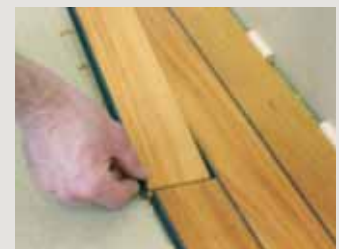
4 - Den Dielenstab an den Abschluss teil des Vorigen aufstellen.