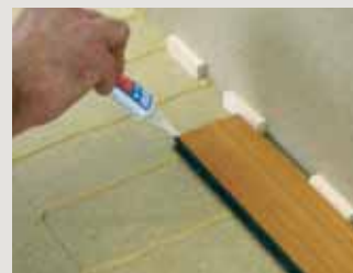
3 - Stirnseitig leimen