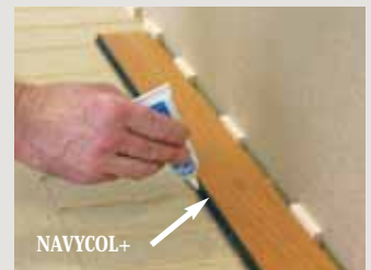
2 - Verleimung der Feder (Rille) mit NAVYCOL+