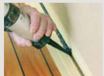
6 - Die ringsum laufenden Dehnungsfugen mit NAVYJOINT -fugenmasse ausfüllen