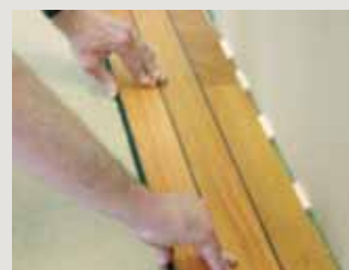
5 - Den Dielenstab dann auf die Länge aufstellen.